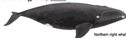
Northern right whale