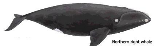
Northern right whale